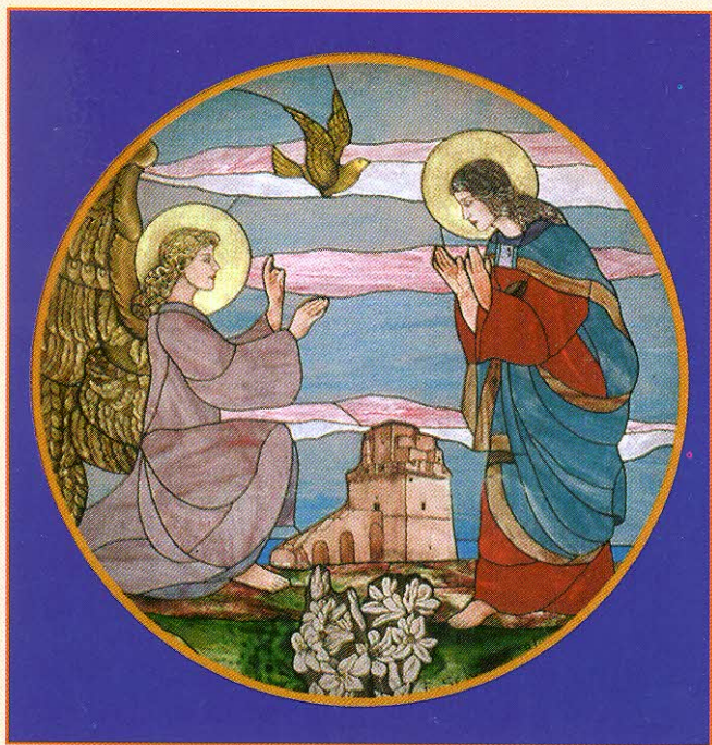
Vetrata istoriata all'ingresso della Chiesa