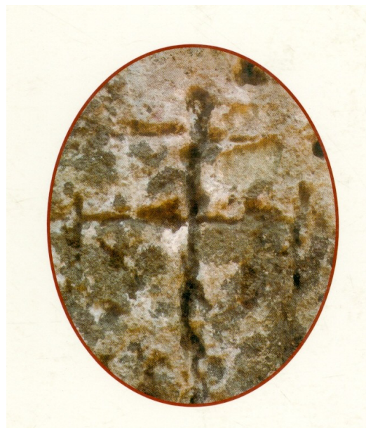
CROCI GRAFFITE Presenze Basiliane nella grotta "la Crava"